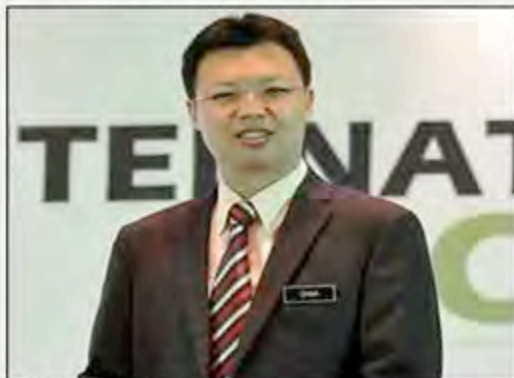
Datuk Chua Tee Yong (file picture)

KUALA LUMPUR, May 27 (Bernama) -- The Royal Malaysian Customs Department has collected RM2.58 billion as Goods and Services Tax (GST) from imports since implementation of the new tax system on April 1.