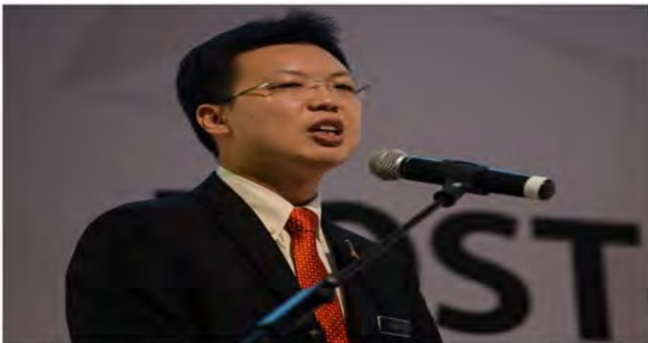
Deputy Finance Minister Datuk Chua Tee Yong says any estimation on the total revenue from the GST can only be made by end-July. - The Malaysian Insider pic by Nazir Safari, May 27, 2015.

The Royal Malaysian Customs Department has collected RM2.58 billion as goods and services tax (GST) from imports since implementation of the new tax system on April 1.