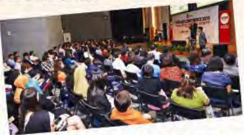
கருத்தரங்கில் கலந்து கொண்டவர்கள்.

எந்தெந்தப் பொருள்களுக்கு உள்ளீட்டு வரியைத் திரும்பக் கோரலாம், எந்தெந்தப் பொருள்களுக்கு இந்த வரியைப் பெற முடியாது என்பதை வர்த்தகர்கள் தெளிவாகப் புரிந்து கொண்டால் ஜி.எஸ்.டி வரி குறித்து அவர்கள் குழப்பம் அடையத் தேவையில்லை என்று இந்த கருத்தரங்கில் வலியுறுத்தப்பட்டது. அதே சமயம், ஜி.எஸ்.டி வரி மூலம் கிடைக்கும் வருமானத்தை அரசாங்கம் எந்தெந்த நோக்கத்திற்காகப் பயன்படுத்துகிறது; இது வரை எவ்வளவு தொகை வசூல் செய்யப்பட்டுள்ளது போன்ற பல்வேறு கேள்விகளுக்கு விளரவில்லை கிடைக்கும் என்றும் இக்கருத்தரங்கில் தெரிவிக்கப்பட்டது.